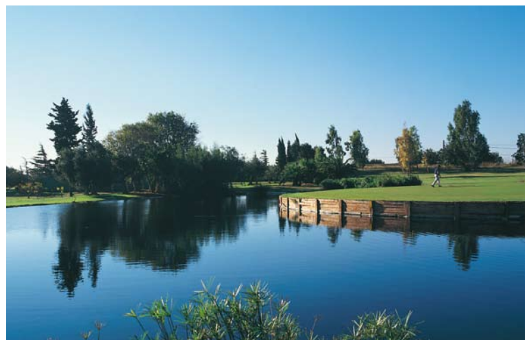
Campo de Golf Les Palmeres d'Aigüesverds, a 10 minutos.