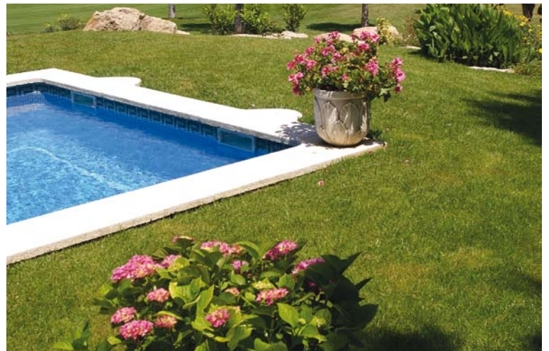
Tratamiento paisajístico global con piscinas comunitarias.