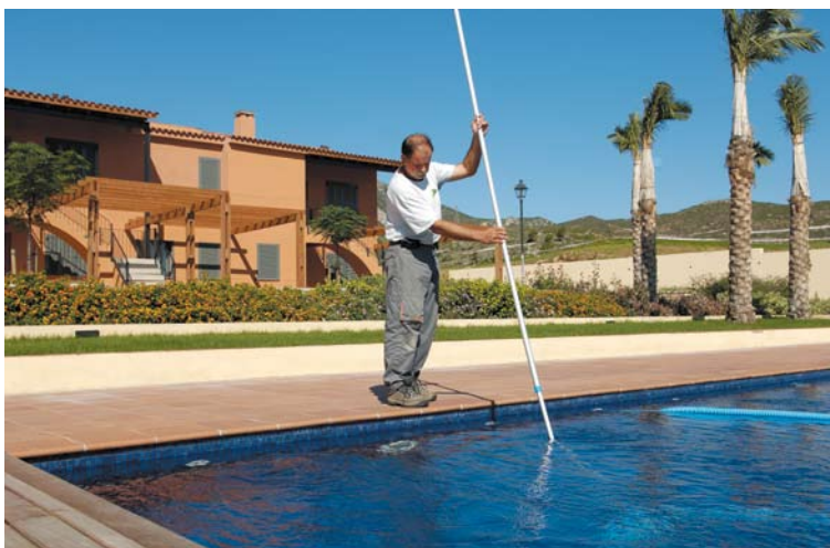
Servicios: mantenimiento de jardinería y piscinas.