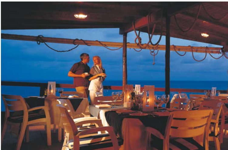
El Club de Mar dispondrá de un Bar/terraza para los residentes.