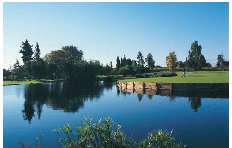
Campo de Golf Les Palmeres d'Aigüesverds, a 10 minutos.