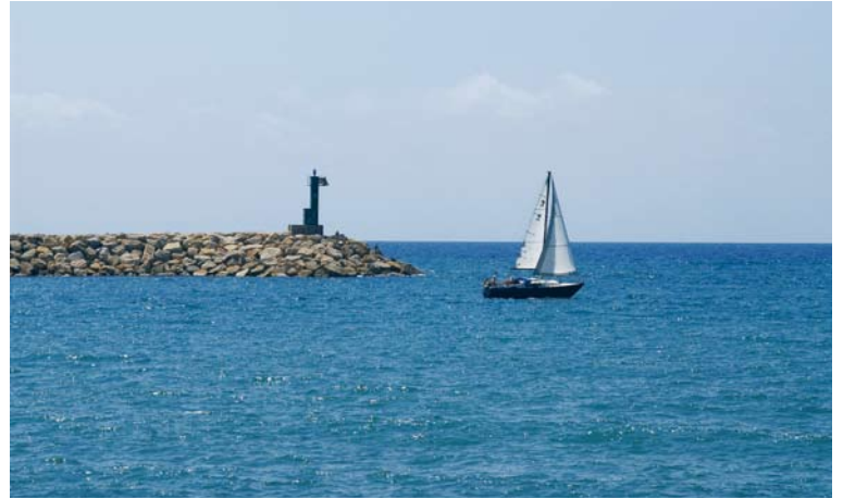
Passeig de Mar es un magnífico paseo abierto al mar.