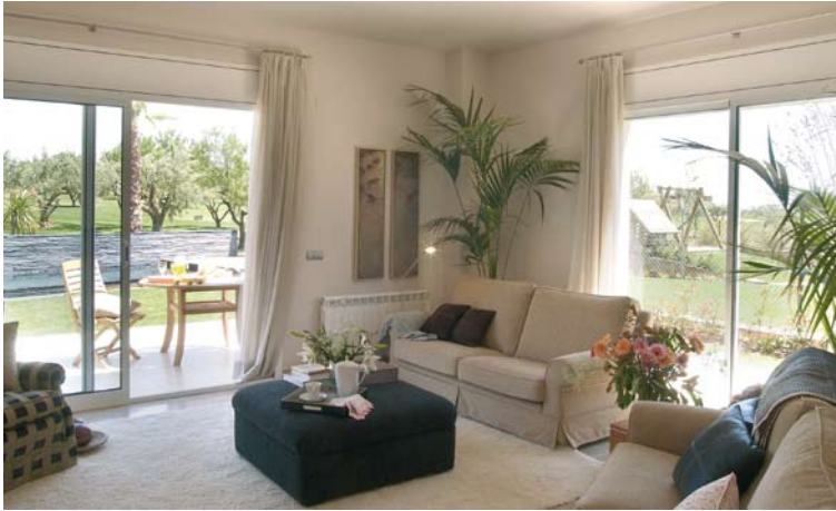
Arquitectura innovadora, de estilo mediterráneo, que combina aspectos estéticos y funcionales.